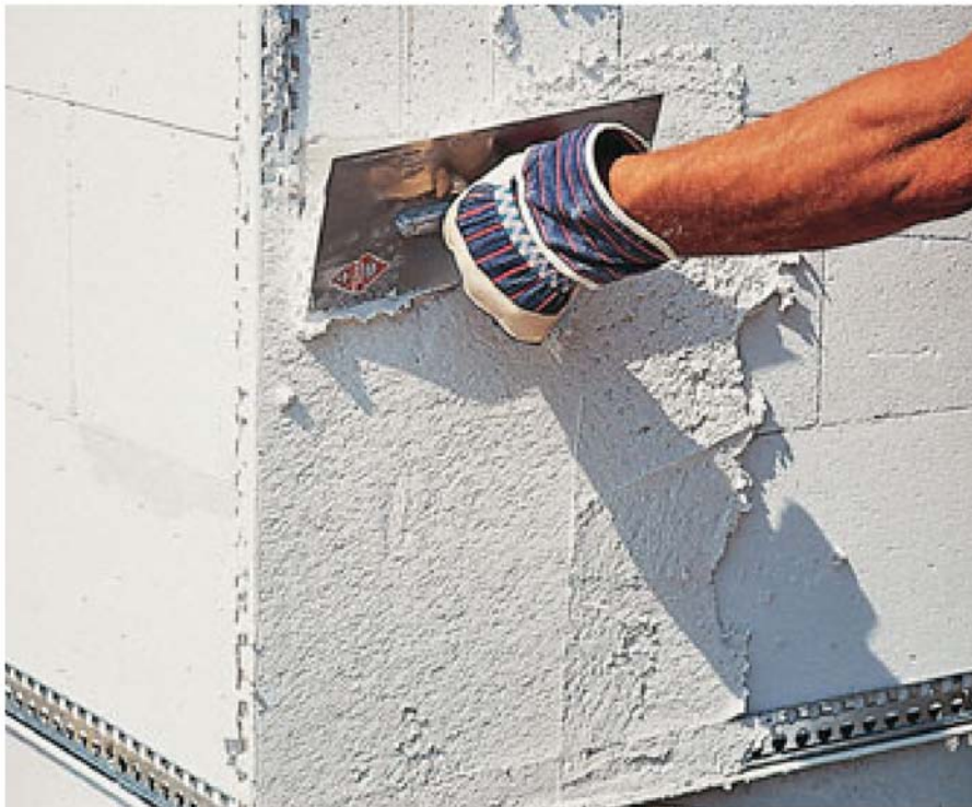
Bild 1: Einlagiger Leichtputz auf Porenbetonmauerwerk; Aufbringen der ersten Schicht von Hand

Leichtputze werden einlagig oder zweilagig als Leichtunter- und Oberputz verarbeitet. Die Anwendung von Leichtputzen ist in der DIN 18550-4 beschrieben. Der Putzgrund muss staub- und fettfrei sein: Mörtelreste und lose Teile müssen entfernt werden. Vor Beginn der Putzarbeiten sind Griffhilfen und Nuten der Steine im Wandbereich sowie evt. vorhandene Schlitzlöcher mit Füllmörtel zu verschließen. Ein Spritzbewurf oder eine Grundierung sind nicht notwendig. Bei anhaltender Trockenheit, Hitze oder starkem Wind muss der Untergrund vorgegässelt werden.