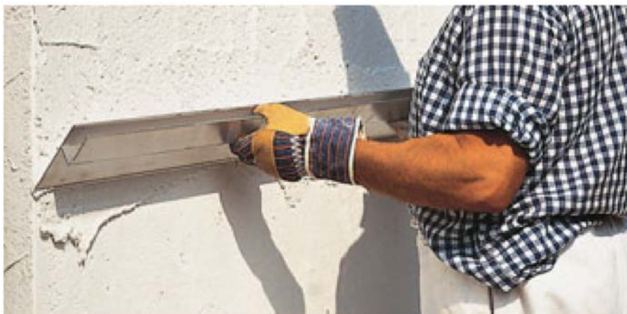
Bild 2: Einlagiger Leichtputz auf Porenbetonmauerwerk; Planebenes Abziehen mit einem Richtscheit