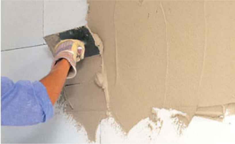
Bild 5: Das Aufbringen eines Innenputzes ist aufgrund der glatten, fast fugenlosen Oberfläche von Innenwänden aus Porenbeton schnell erledigt.