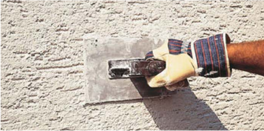
Bild 3: Einlagiger Leichtputz auf Porenbetonmauerwerk; Zweite Schicht in Kornstärke auftragen und strukturieren

Alle vom Erdboden berührten Außenflächen der Wände sind gegen seitliche Feuchtigkeit abzudichten. Diese muss planmäßig bis 300 mm über Gelände hochgeführt werden, um ausreichende Anpassungsmöglichkeiten der Geländeoberfläche sicherzustellen, jedoch darf sie im Endzustand nicht weniger als 150 mm betragen. Oberhalb des Geländes darf die Abdichtung entfallen, wenn dort ausreichend wasserabweisende Bauteile verwendet werden. Anderenfalls ist sie hinter der Sockelbekleidung hochzuziehen. Die Abdichtung muss unten bis zum Fundamentabsatz reichen und so an die waagerechte Abdichtung herangeführt oder verklebt werden, damit keine Feuchtigkeitsbrücken entstehen können. Vor den abgedichteten Wandflächen sind Schutzschichten vorzusehen.