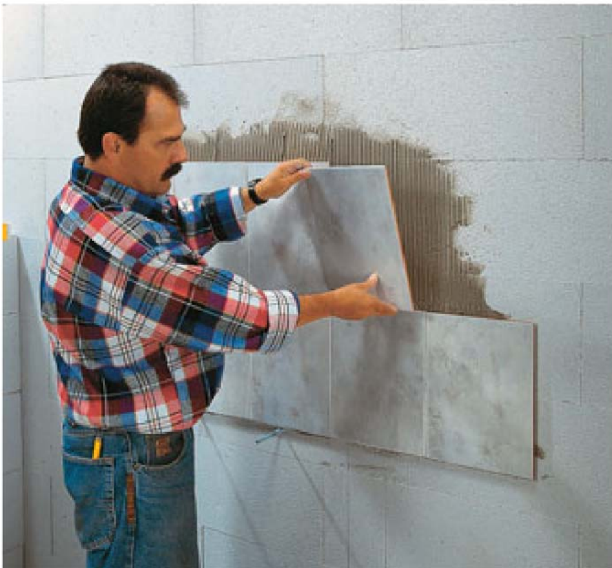
Bild 6: Verkleben von Wandfliesen direkt auf der Porenbeton-Mauerwerksoberfläche