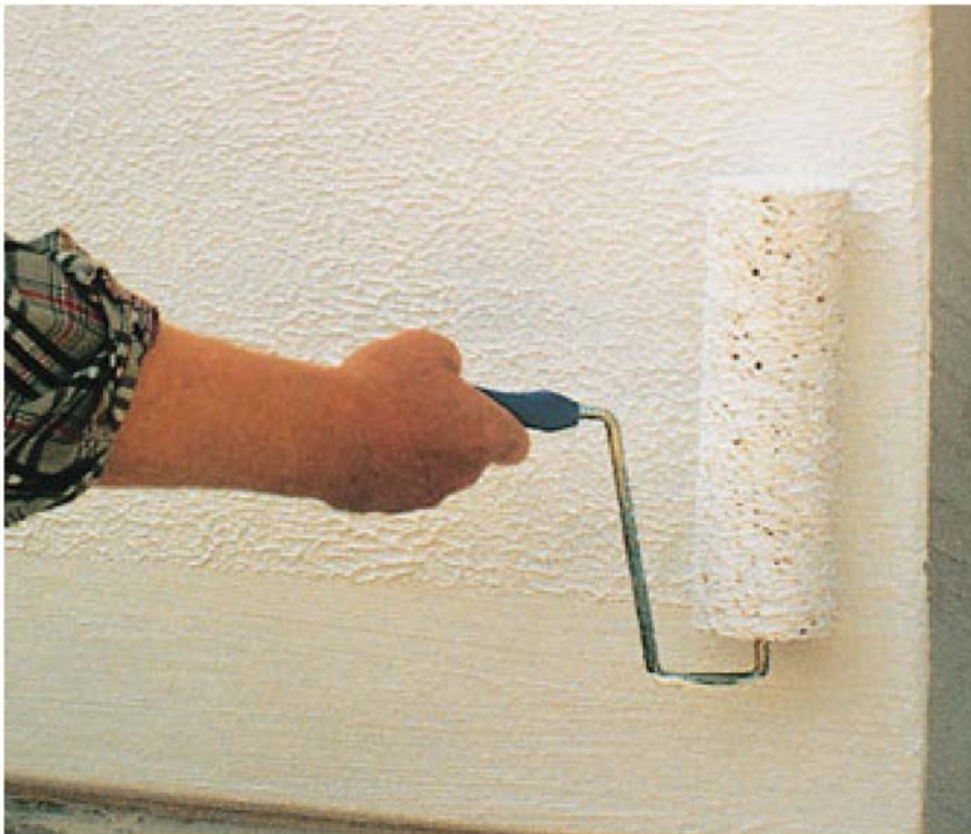
Bild 7: Porenbetonbeschichtung auf Dispersionsacrylatbasis mit strukturierter Oberfläche; Auftragen der Schlussbeschichtung mit einer Schaumstoffstrukturwalze

Von den bekannten Herstellern von Beschichtungstoffen werden speziell auf den Porenbeton abgestimmte Außenbeschichtungen angeboten. Hierzu zählen Beschichtungen auf Dispersionsacrylat- und auf Dispersionssilikatbasis mit glatter oder strukturierter Oberfläche.